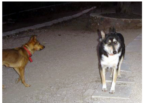
Meli und Franzi

Franzi starb nach einem operativen Eingriff am 09.03.2009. Er wird immer in unseren Herzen bleiben.