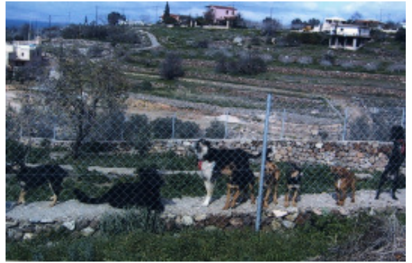
Mit einem Rudel Welpen