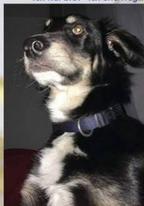
Ich war brav - ich und weg...