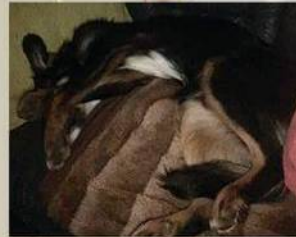
Pfötchen sauber machen... muss das sein ?!