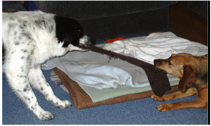
Vara mit Poldi

Ihr plötzlicher Tod traf Varas Familie schwer. Sie schrieb uns: