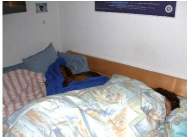
Mit dem Herrchen beim Schmusen und mit Frauchen beim Schlafen.

In ihrer neuen Heimat fand Vara nicht nur viele kuschelige Ecken im ganzen Haus sondern auch